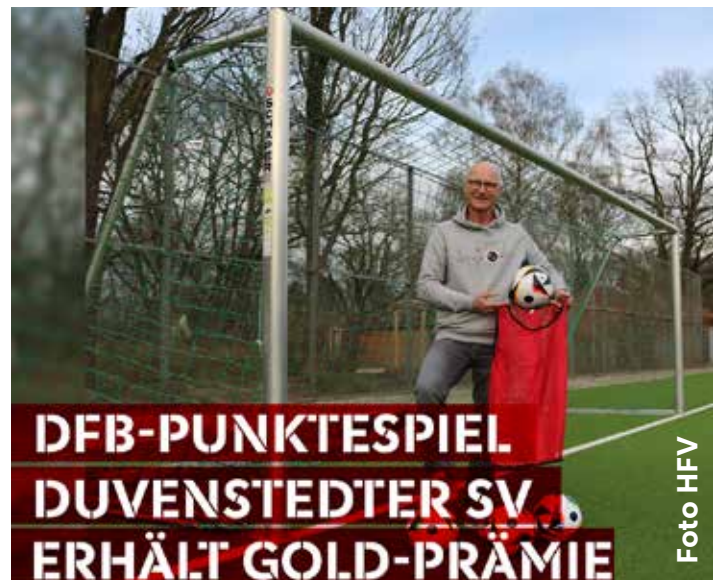
Vereinsvertreter des Duvenstedter SV nimmt das Gold-Prämien-Paket in Empfang.

Am vergangenen Mittwoch durften die Vereinsvertreter des Duvenstedter SV ihre Gold-Prämie in Empfang nehmen. Das Team erhielt das Premium Trainings-Paket mit Minatoren, Bällen, Leibchen und Equipment-Gutschein. Aus vielen verschiedenen Prämien kann sich jeder Verein etwas Nützliches aussuchen. Darüber hinaus kann im Gold-Level an der Verlosung teilgenommen werden. Unter anderem wäre ein GOLD-Hauptgewinn aus der Verlosung zum Beispiel ein Tag mit der Nationalmannschaft der Männer oder Frauen auf dem DFB-Campus. Viel Spaß mit dem Trainingspaket und beim fleißigen Punkte sammeln. Auf https://punktespiel.dfb.de/ können alle Informationen rund ums Punkte sammeln eingesehen werden.