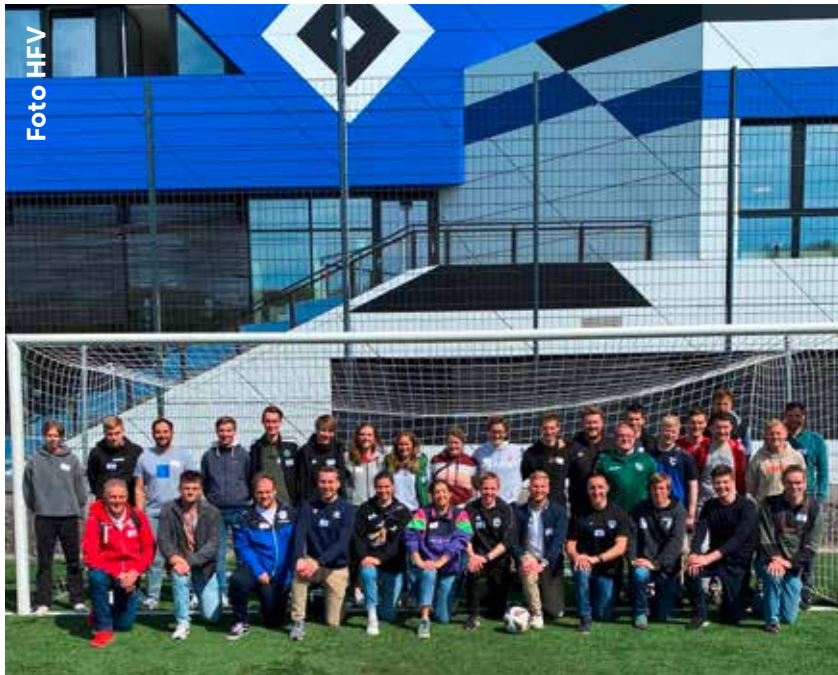
Gruppenbild der Fußballheld*innen aus Bremen, Mecklenburg-Vorpommern, Schleswig-Holstein und Hamburg