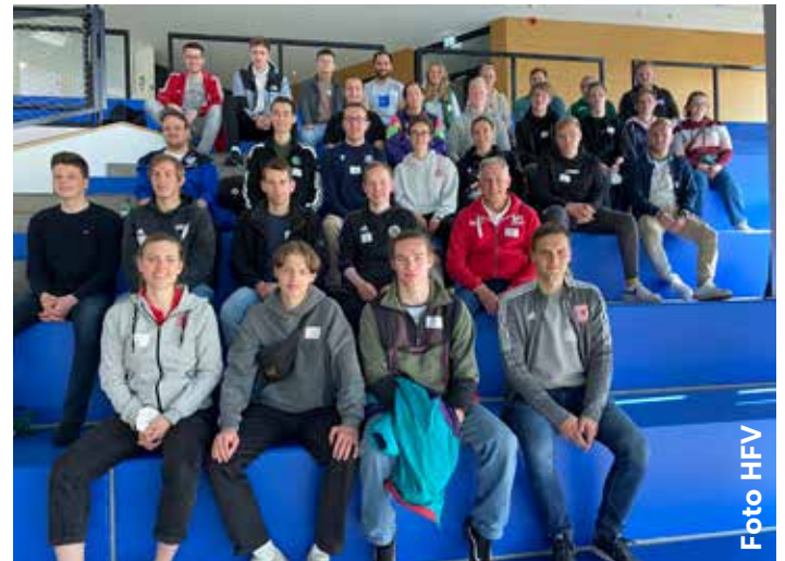
Beim HSV bekamen die Fußballheld*innen einen Einblick in das Nachwuchsleistungszentrum