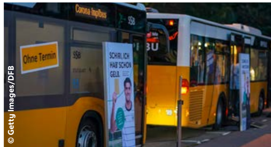
Im Rahmen des Länderspiels oft besucht: der Impfbus in Hamburg

Platziert war die Impfstation am Freitag an Uwe Seelers Fuß, zur Verfügung standen wahlweise der mRNA-Impfstoff von Biontech sowie das Janssen-Vakzin, bei dem eine einmalige Impfung ausreichend ist. Betreut wurde die Impfstation von einem Impfteam im Auftrag der Sozialbehörde