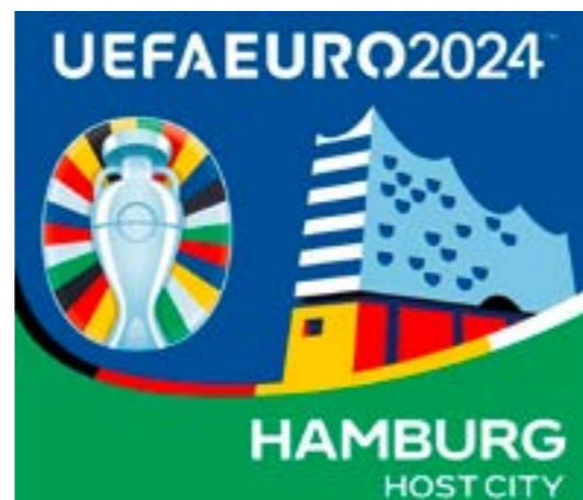
Das Logo von Hamburg als Ausrichterstadt der UEFA EURO 2024