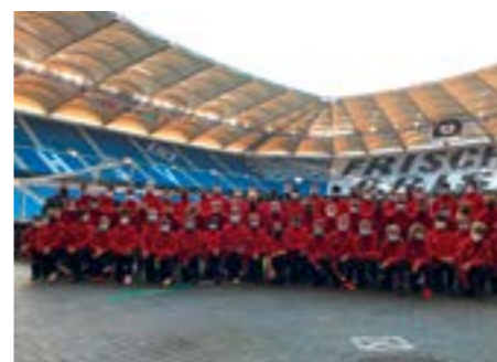
HFV-Talente im Volksparkstadion

nen klasse Job gemacht und eine eindrucksvolle und fehlerfreie Zeremonie auf den Rasen gezaubert: Ein tolles Erlebnis, welches lange in Erinnerung bleibt! Die Kinder wurden von ihren DFB-Stützpunkttrainern begleitet, welche ebenfalls einen starken Beitrag geleistet haben, damit die Eröffnungszeremonie und damit der gesamte Tag ein toller Erfolg werden konnte.