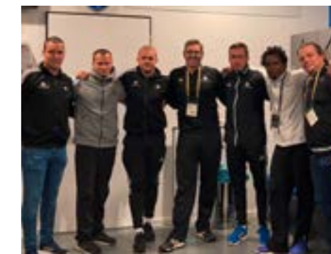
DFB-Stützpunkttrainer des HFV im Einsatz