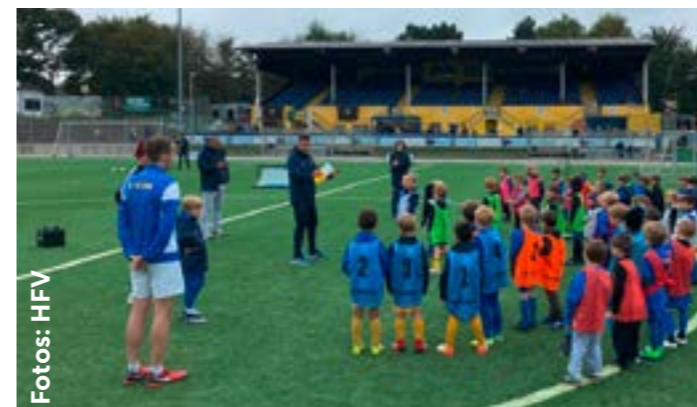
Letzte Besprechung, dann geht's los: Trainer und Kids waren im Auftrag des DFB unterwegs

Seit Sommer laufen die neuen Kinderspielformate des DFB auch in Hamburg. Die Vereine, die diese erfolgreich umsetzen, konnten bereits einen ersten Mehrwert erkennen. Mit dem Ziel, die pas-