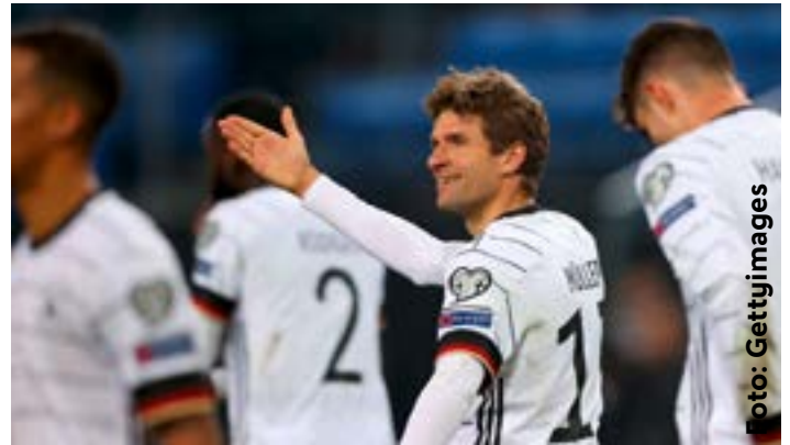
Freude bei Thomas Müller nach dem 2:1

richten gerne vorstellen wollen. Dank geht an dieser Stelle vor allem an die vielen Volunteers und die Nachwuchstalente des HFV, die mit ihrem Einsatz sehr zum Gelingen des Länderspiels beigetragen haben.