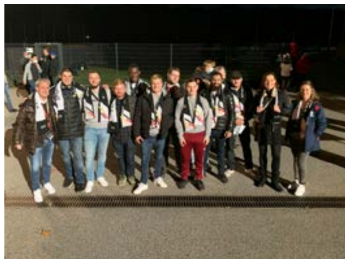
Erinnerungsfoto mit Pierre Littbarski (links) vor dem Stadion