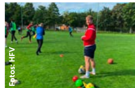
Die Teilnehmenden beim Warm-up

Besonders war an diesem Kurs, dass er als Hybrid-Lehrgang umgesetzt werden konnte. Mit Anteilen im digitalen Format – was nicht bedeutete, dass Teilnehmende Bälle im Homeoffice fliegend zu parieren hatten, sondern alle Teilnehmenden