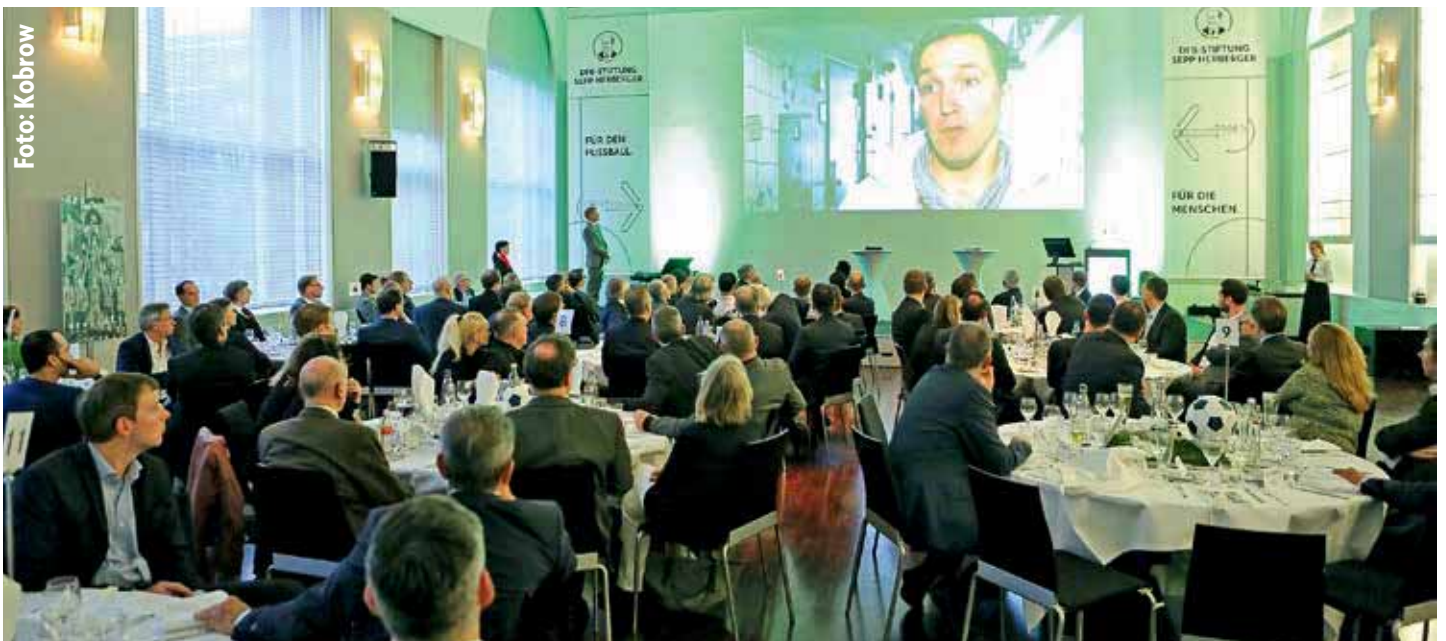
Feierliches Ambiente bei der Verleihung

Im vergangenen Jahr zählten unter anderem der SV Blau-Weiß Aasee, der FC Schalke 04, der Saarländische Fußballverband und die Schiedsrichtervereinigung aus Buchen zu den 13 Preisträgern. Der Horst-Eckel-Preis ging an die JSG Hannover-West. Weitere Informationen unter www.sepp-herberger.de/urkunden