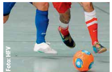
Foto: HFV Junioren-Futsal steht am 20. Januar beim HFV im Mittelpunkt

Den Start machen die Halbfinals der Mannschaften der C-Junioren um 9 Uhr. Die B-Junioren starten um 12:30 Uhr. Das erste A-Junioren-Halbfinale soll um 16:00 Uhr angepfeiffen werden. Das Finale der A-Junioren steht für 19:30 Uhr auf dem Programm. Die Gewinner-Teams können sich über